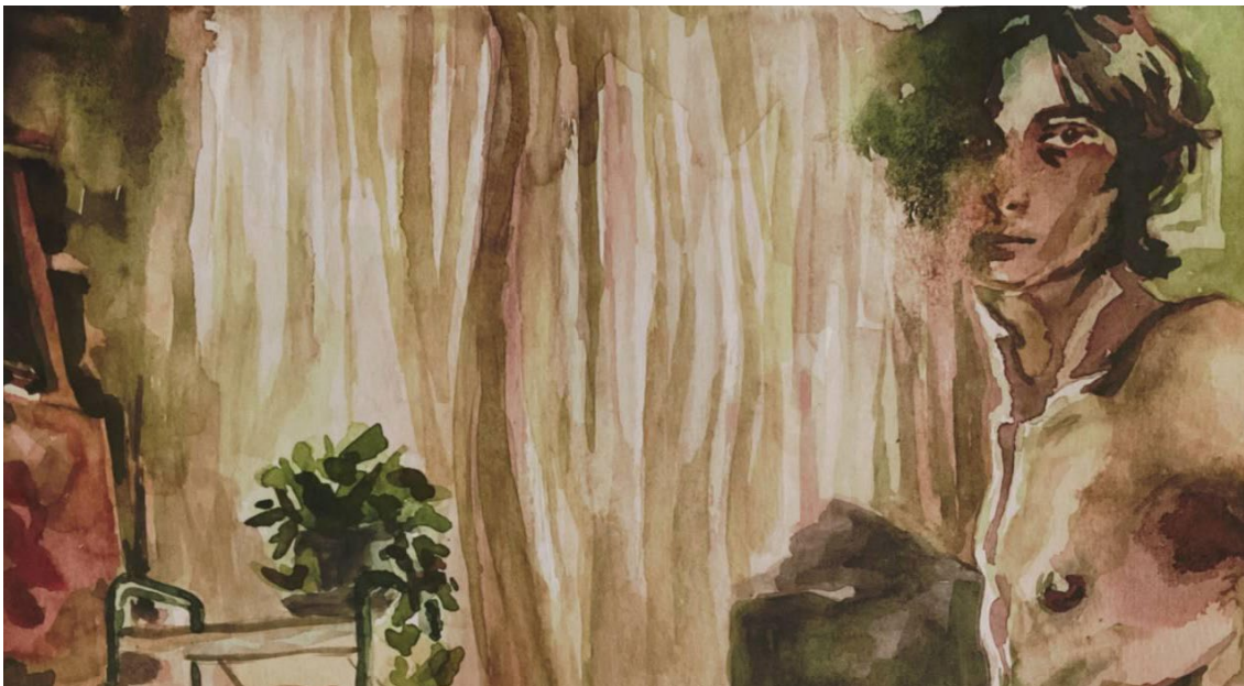
Fig. 1. Eric Gómez (2023). Autorretrato I . Acuarela sobre papel. 21 x 28 cm.