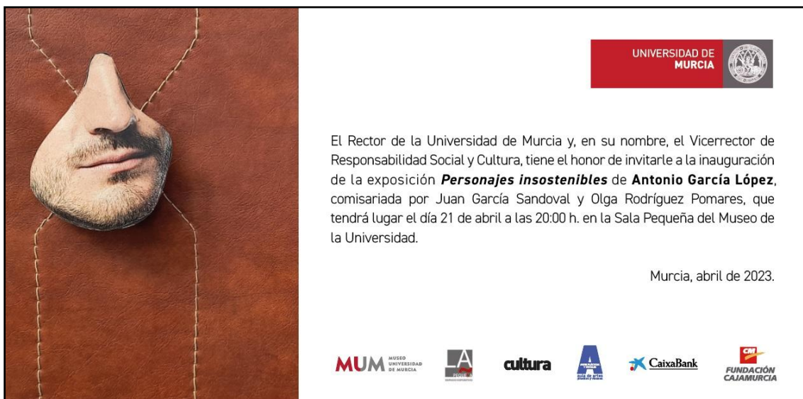
Fig. 1. Invitación.

Vídeo visita guiada: https://www.youtube.com/watch?v=ljuK0RqnRNw