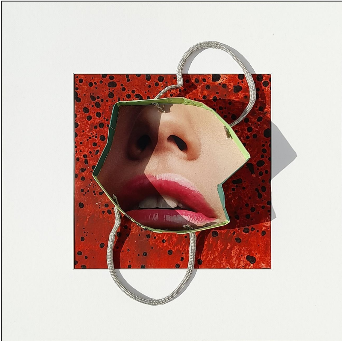
Fig. 10. García López, Antonio (2023). Compradores compulsivos / Compulsive Shoppers [Collages]. Acrílico, alquídico, papel y textil / Caja de DM, 50 x 50 cm.