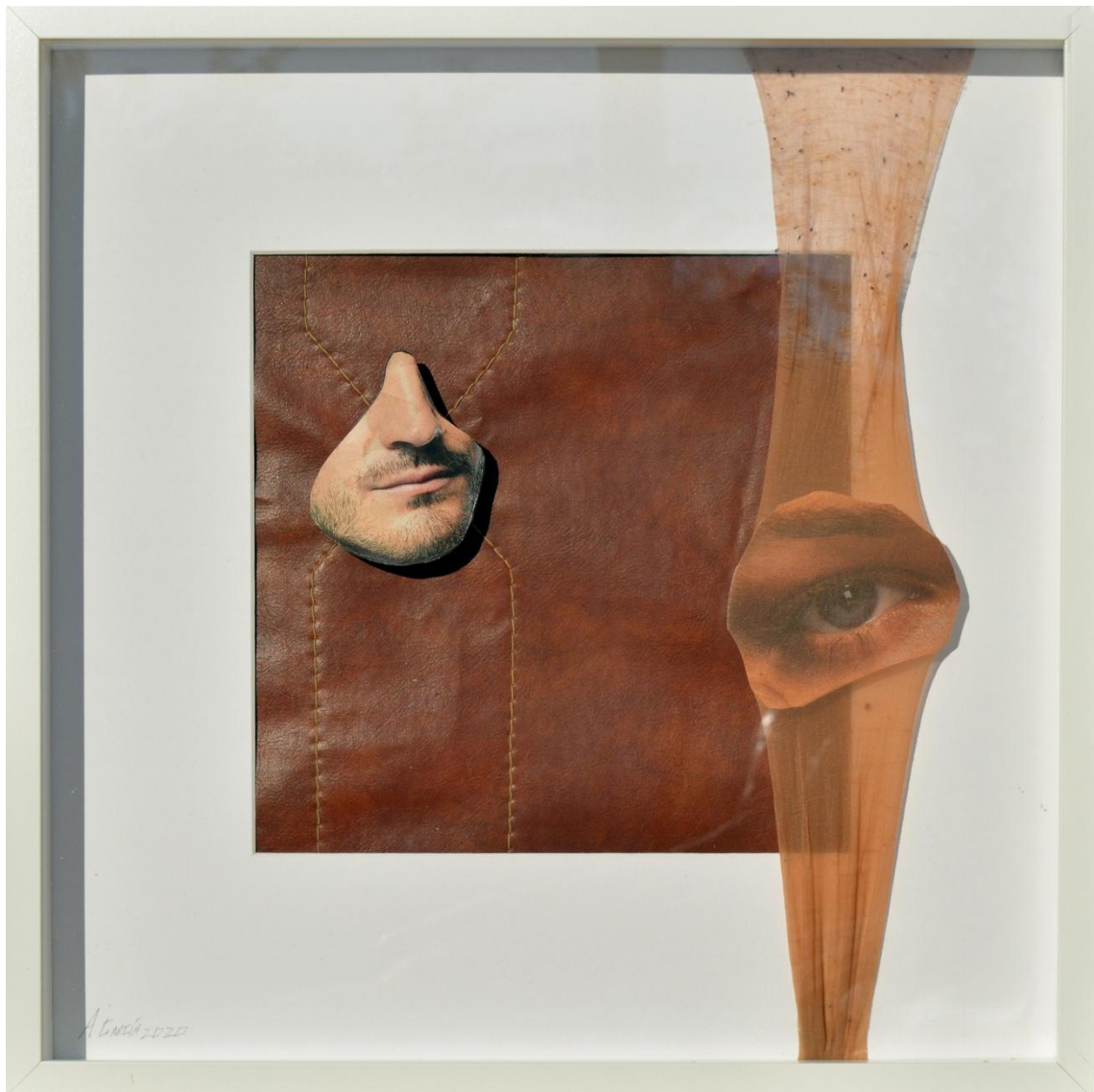
Fig. 9. García López, Antonio (2020). Los insectos / The insects [Collages]. Escay, panty, papel y textil / Caja de DM, 50 x 50 cm.

Los humanos nos parecemos más a los insectos de lo que nosotros mismos pensábamos, y es que la lucha sin cuartel por estar bien posicionados habla de nuestra naturaleza y de la falta de escrúpulos a la hora de usurpar el talento de otros. Del mismo modo, nuestra proliferación y nuestro modo de utilizar los recursos, también nos convierte en una verdadera plaga para el planeta.