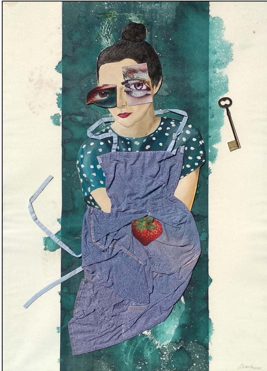
Fig. 12. García López, Antonio (2020). La criada / The maid . [Collages]. Acrílico, acuarela, papel, fibra textil / Caja de DM, 100 x 75 cm.

La criada elegida nació en una época libre, y ahora se enfrenta a la espera de ser desechada por su infertilidad, recupera recuerdos de su vida anterior, reflexiona sobre los poderes que las mujeres de otras décadas habían conquistado. Nuestra criada hace frente a la pérdida de todo, desde su propio cuerpo hasta su familia, así como a la falta de destino y anulada personalidad.