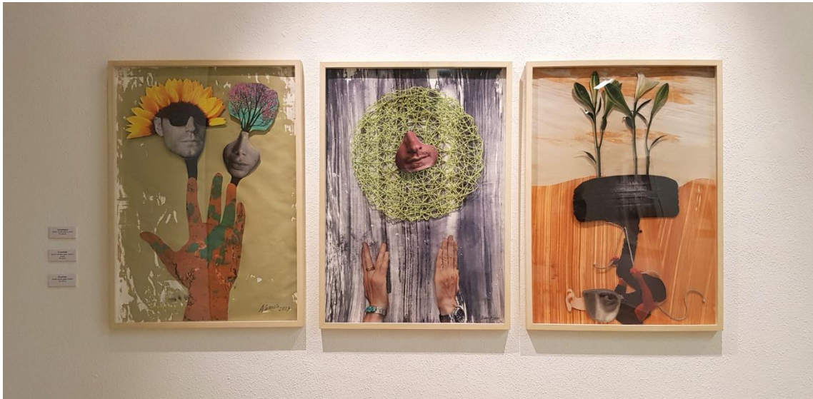
Fig. 14. García López, Antonio (2023). Los ecológicos, el sostenible y el reciclado. Serie Personajes insostenibles [vista sala]. MUM Museo de la Universidad de Murcia