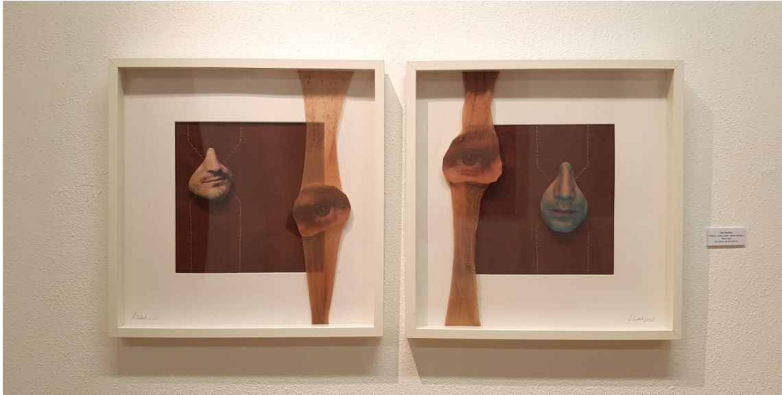
Fig. 18. García López, Antonio (2023). Los insectos [Collage]