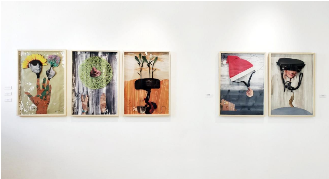
Fig. 19. García López, Antonio (2023). Serie Personajes insostenibles [Collage]