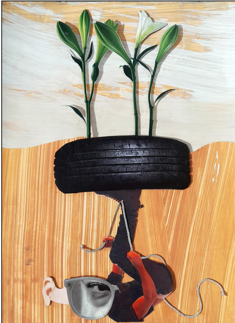
Fig. 5. García López, Antonio (2023). El reciclado / Recycling . [Collages]. Acrílico, arcilla, papel, y textil / Caja de DM. 70 x 50 cm.

La idea de reciclar se vende como algo nuevo, pero el reciclaje siempre ha existido. Hemos de recordar que reciclar es un modo de vida asociado negativamente a los tiempos de carestía y quizás por ello nos cueste tanto aplicarlo en nuestro mundo consumista.