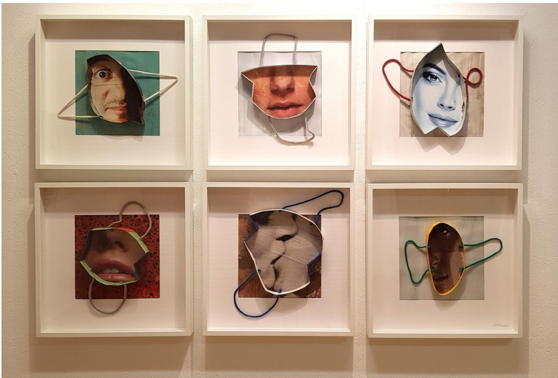
Fig. 17. García López, Antonio (2023). Compradores compulsivos [Collage]