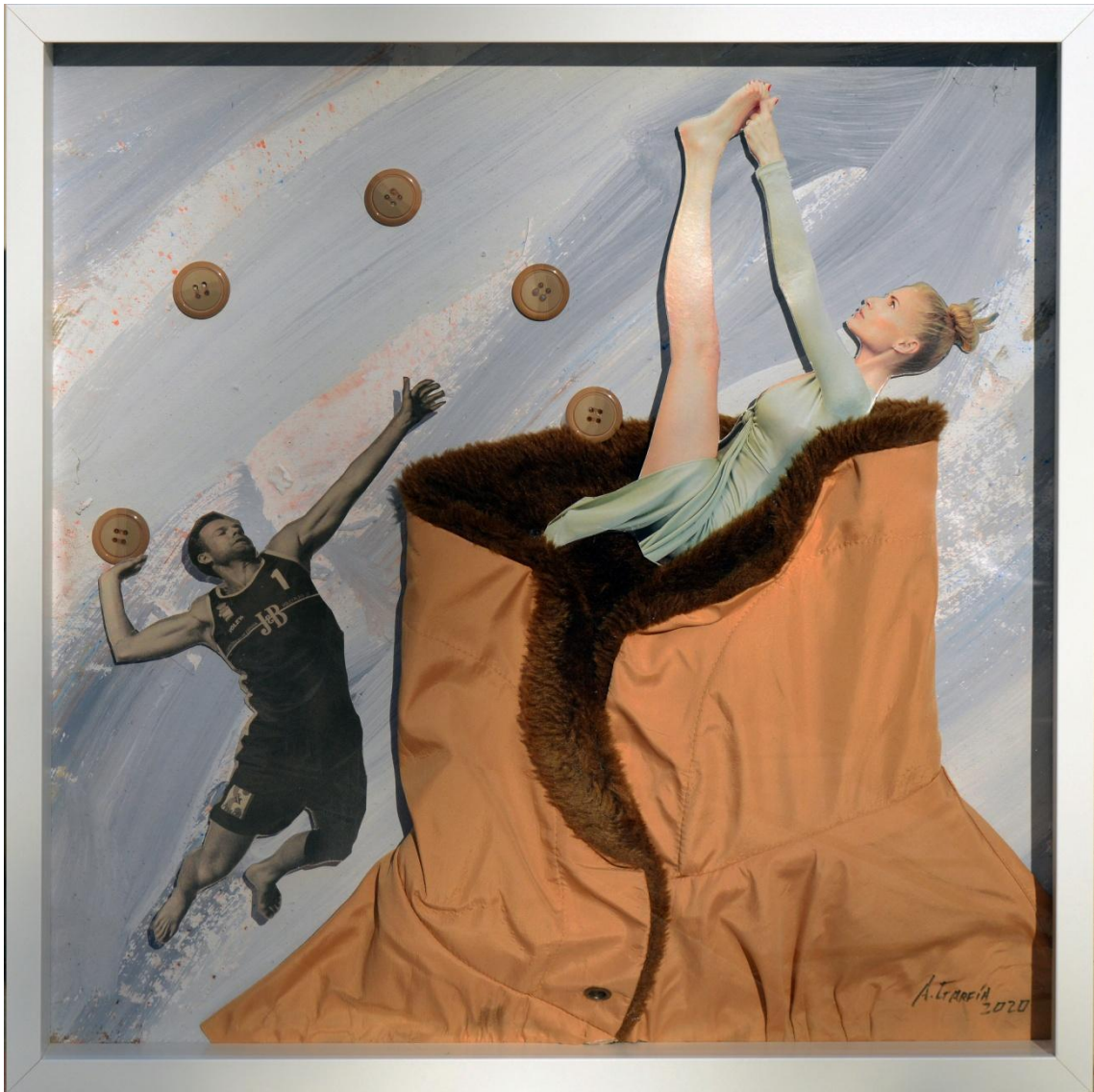
Fig. 7. García López, Antonio (2020). La última cima / The last peak [Collages]. Acrílico, botones de plástico, papel y fibra textil / Caja de DM, 50 x 50 cm.

Hoy no es posible encontrar ni un solo punto virgen en la tierra donde el hombre no haya explotado sus recursos, o haya alterado su hábitat. Hasta la cima más alta del mundo, ha sido pasto de la masificación y de colas kilométricas para obtener el selfie que acredite la proeza. Así, la última cima, alejada de los tiempos heroicos, se ha convertido en un objeto de consumo más y en reclamo para turistas, pero también en el vertedero de basura más alto del mundo.