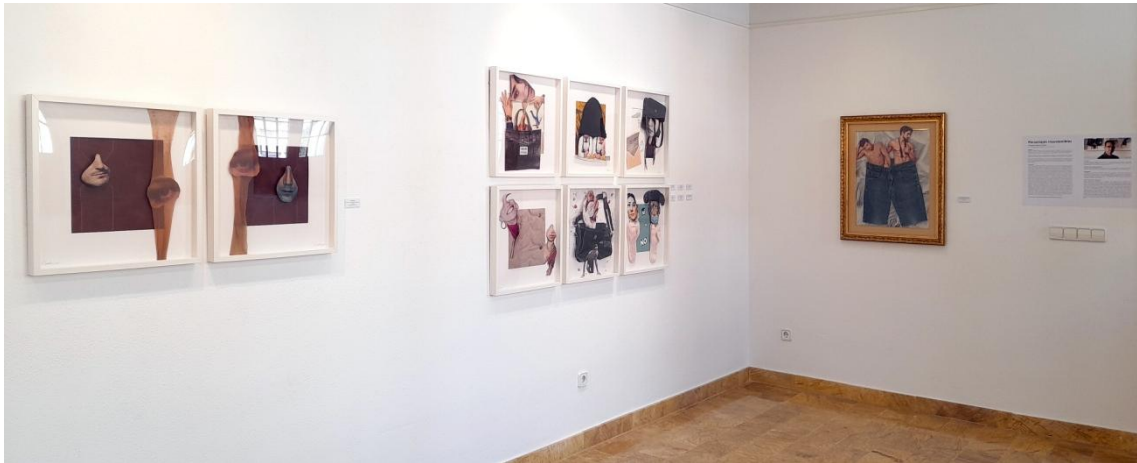
Fig. 15, 16, 17. García López, Antonio (2023). Personajes insostenibles [vistas sala]. MUM