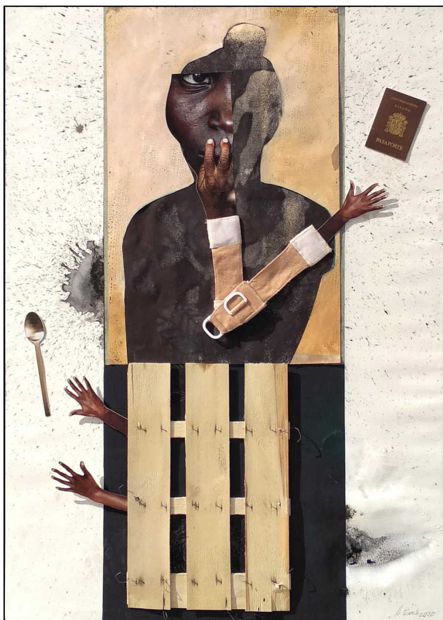
Fig. 11. García López, Antonio (2020). Sin papeles / Undocumented . [Collages]. Acrílico, acuarela, papel, caja de madera y textil / Caja de DM, 100 x 75 cm.

En este mundo globalizado y cada vez más desigual, uno de los grandes retos es la inmigración irregular o ilegal, flujo descontrolado de movimientos migratorios de personas a través de las fronteras. Dramas humanos, negocio para las mafias, y al tiempo armas arrojadizas entre países.