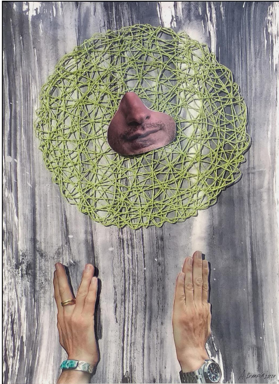
Fig. 3. García López, Antonio (2020). El sostenible / The Sustainable . [Collages]. Acrílico, acuarela, papel y fibra textil / caja. 70 x 50 cm.

Mucho se habla de la economía circular, como alternativa sostenible que impida la destrucción de nuestro hábitat y minimice el agotando de los recursos. Pero ha hecho falta una pandemia para dar un respiro a nuestros entornos y para que se produzca una reducción considerable, tanto de emisiones, como de extracción de materias primas.