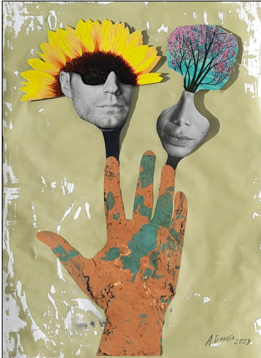
Fig. 6. García López, Antonio (2023). Los ecológicos / The environmentally friendly . [Collages]. Acrílico, arcilla y papel/ Caja de DM. 70 x 50 cm.

Los recursos del planeta están siendo agotados a gran celeridad y una de las soluciones que se plantean pasa por una suerte de inteligencia ecológica derivada de una inteligencia emocional y social. Sin empatía hacia el entorno que habitamos, difícilmente seremos capaces de pensar sobre el impacto contaminante de nuestras acciones.