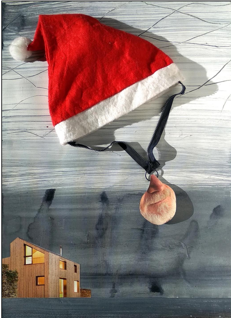
Fig. 4. García López, Antonio (2020). El paracaidista / The Parachutist . [Collages]. Acrílico, acuarela, grafito, papel, cremallera y textil / Caja de DM. 70 x 50 cm.

Hay muchas formas de someter a un territorio, fenómeno conocido por colonialismo, hoy quizás más discreto pero eficiente que nunca en cuanto a dominio económico y cultural. Ejemplo de ello está en el paisaje navideño, donde los Reyes Magos de Oriente han sido sustituidos por Santa Claus.