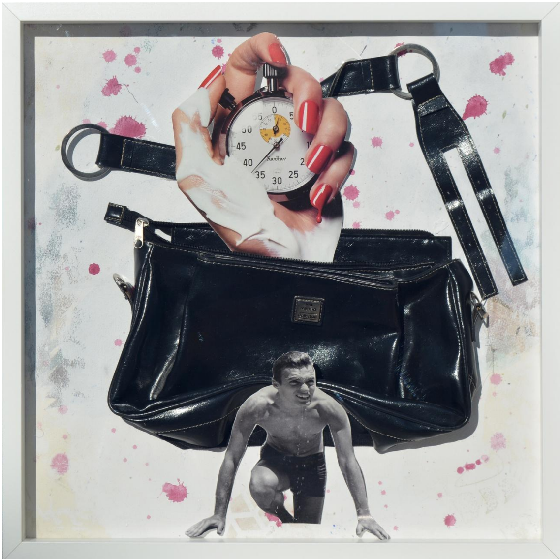
Fig. 8. García López, Antonio (2020). Alta resistencia / Highresistance [Collages]. Acrílico, pigmentos, papel y bolso / caja 50 x 50 cm.

La máxima resistencia a la tracción indica la tensión máxima que un material puede soportar antes de romperse. Es curioso ver como en el mundo actual el capitalismo ha logrado prolongar su vida útil artificialmente, incorporando la obsolescencia programada como un modo de acortar la vida útil de los productos, obligando así a repetir hasta el infinito la necesidad de usar y tirar.