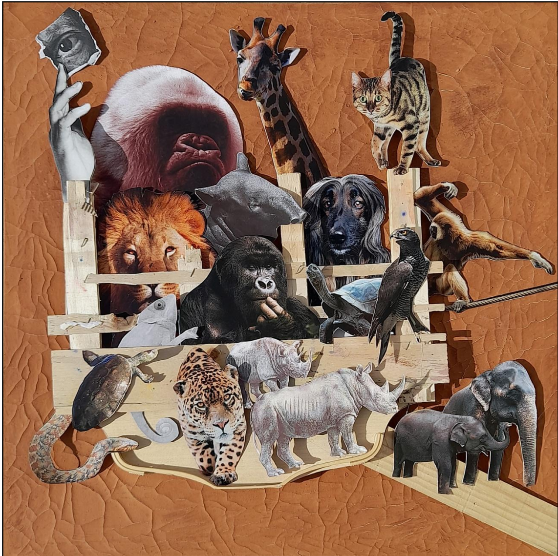
Fig. 13. García López, Antonio (2023). Noé y su arca / Noah and his ark [Collages]. Creta, arcilla, papel y madera / tela, 70 x 70 cm.

Dios le dijo a Noé que hiciera el arca de modo que no le entrara agua. La amenaza apocalíptica de que un gran diluvio destruiría el mundo, hoy se ha tornado en sequía extrema y por tanto la extinción masiva está más presente que nunca.